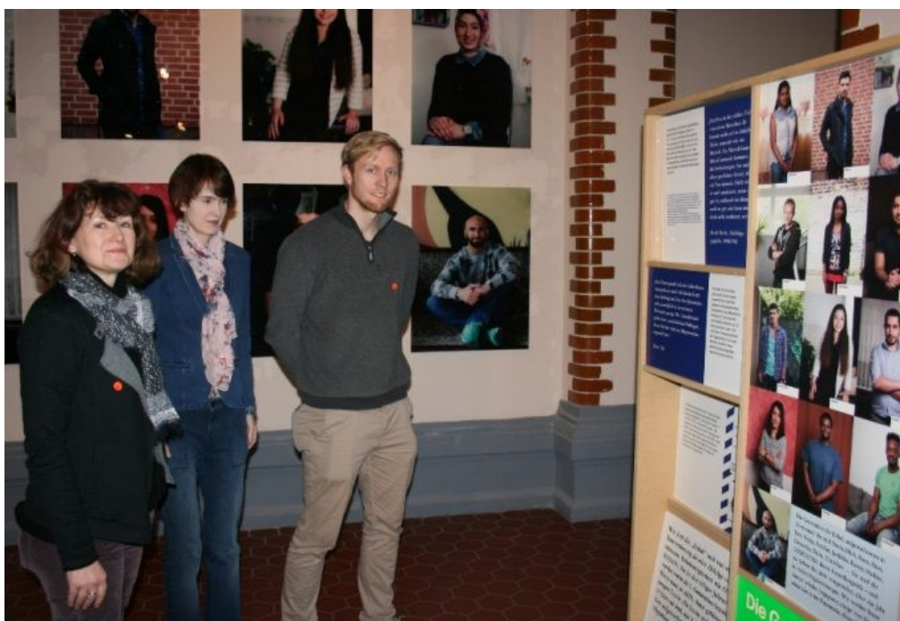
Lehrer und Lehrerinnen der Gesamtschule Eilpe in der Ausstellung Hasan, die noch bis zum 29. Januar geöffnet ist.